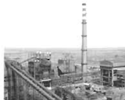
Captive Power Plant