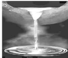
Electric Arc Furnace